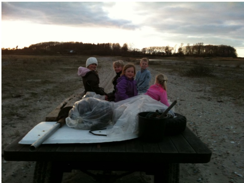
Billede fra Strandrensningen 13. April