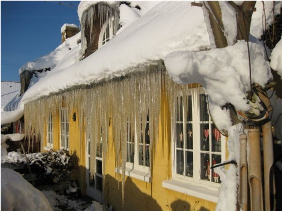
Lone Stengers hus i vinterbeklæding